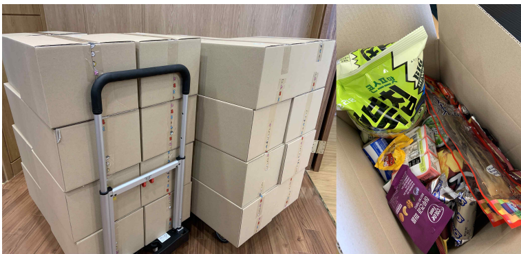
(사진1) 기숙사에 격리조치된 대구·경북지역 출신 신입생들에게 서신과 함께 전달된 위로 물품