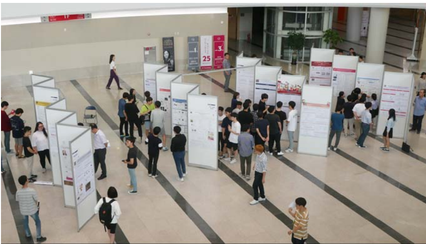
[사진 1] 2018년 G-SURF 포스터 발표회장 모습(GIST 오룡관 로비)