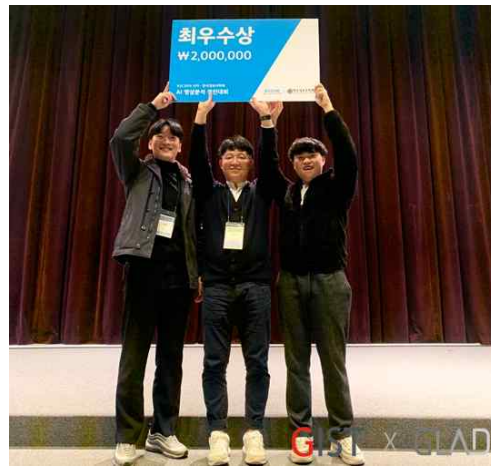
[사진 1] AI 영상분석 경진대회 '최우수상' 수상