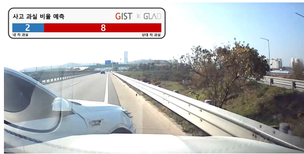
[그림 2] 네트워크 학습 결과